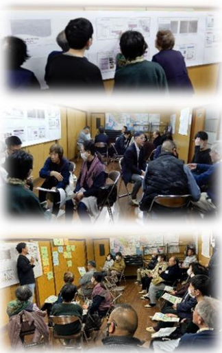
まちづくりコンセプトブック(案)を皆さんと見た後、まちづくりコンセプトについて意見を出し合いました！

皆さんからのご意見を踏まえて完成するまちづくりコンセプトは、令和6年2月開催予定の報告会等で周知する予定です。