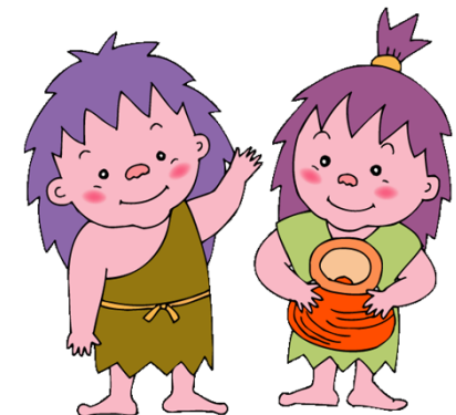
播磨町マスコットキャラクター 「いせきくん」と「やよいちゃん」