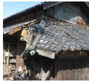
緊急代執行を要する崩落しかけた屋根