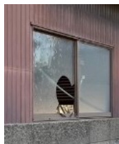
窓が割れた管理不全空家