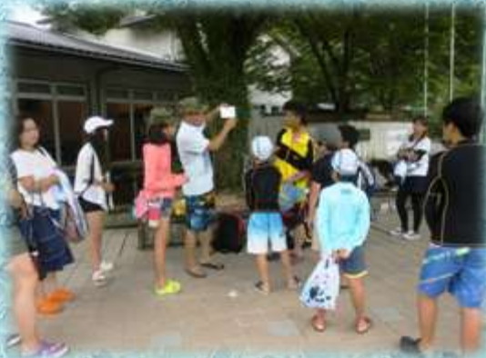
【エコアップ塾による水質調査指導】