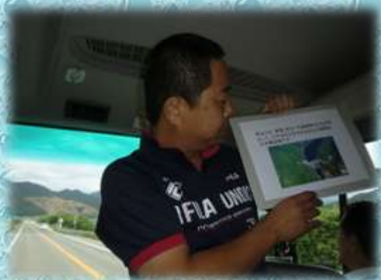
【ダムクイズに挑戦】