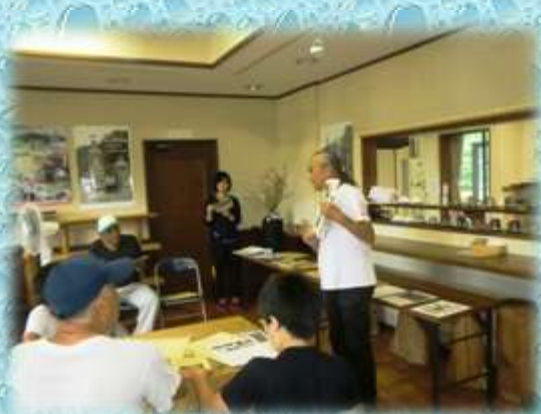
【職員の方に丁重にお話しして頂きました】

市川の源流、黒川のオオサンショウウオの生態や自然環境保全、生態系の保全、外来種との交配の問題等、調査研究に取り組んでおられる日本ハンザキ研究所の方に楽しくお話しして頂きました。