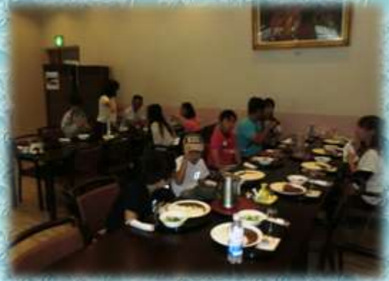
【食事をしながら交流を深めました】