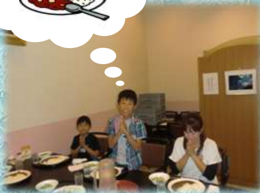
【ふれあいの家での食事】