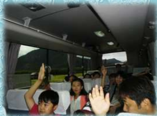
【大人も子供も楽しんで学習】