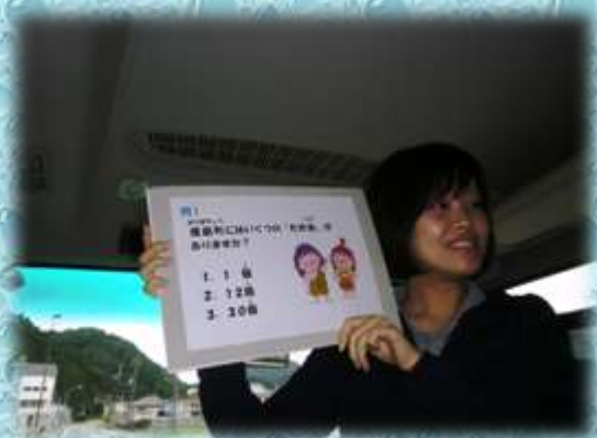
【ため池クイズに挑戦】