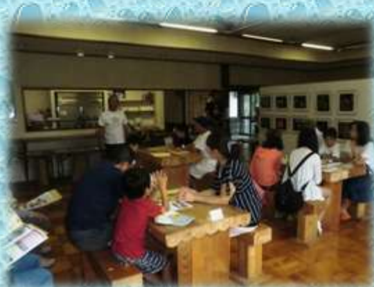
【お話しを聞く参加者】