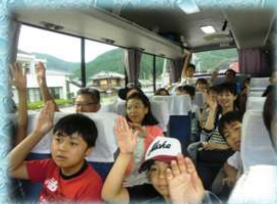
【大人も子供も楽しんで学習】