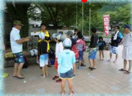
【ふれあいの家の前の池の水質は？】