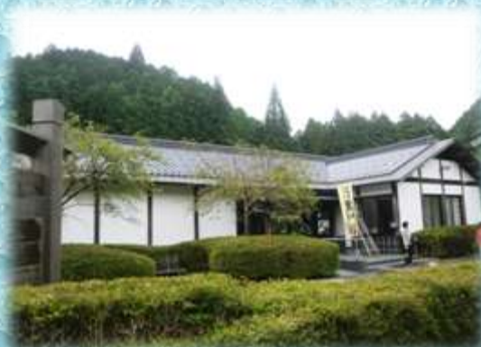
【黒川自然公園センター】