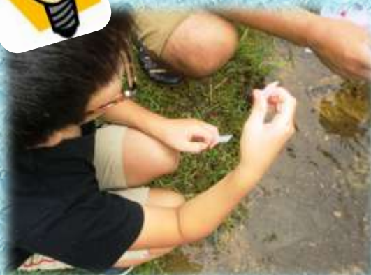
【多々良木川、子供水質調査】