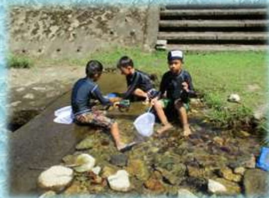
【観察した生き物は全てリリース】