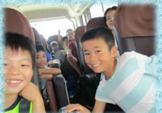
【子供たちもノリノリ!】