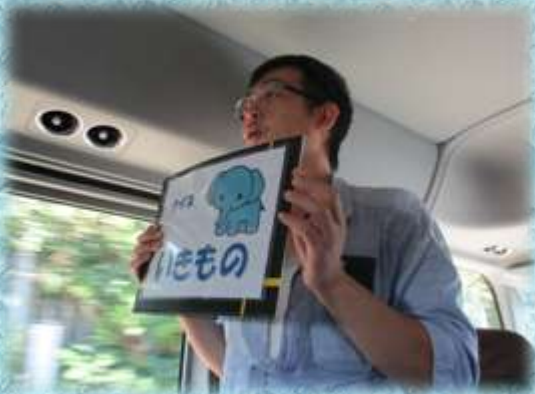
【生き物クイズに挑戦】