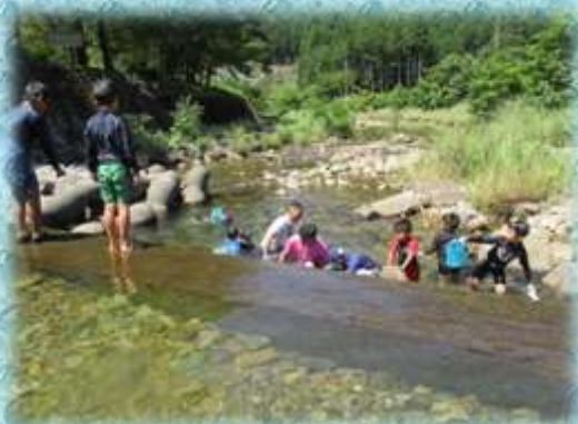
【水中生物観察のはじまり】