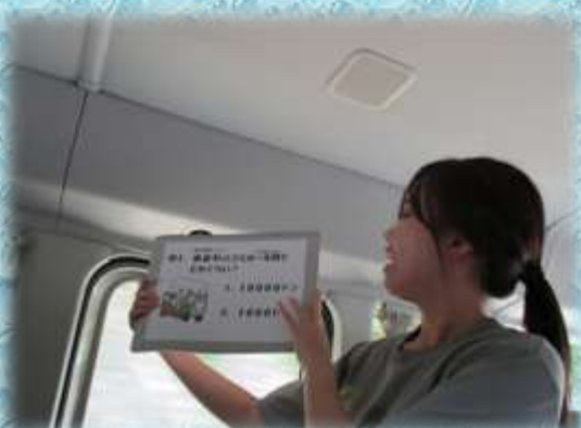
【環境クイズに挑戦】