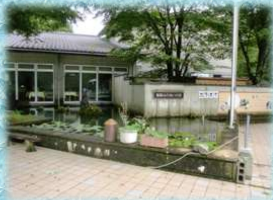
【朝来市ふれあいの家】