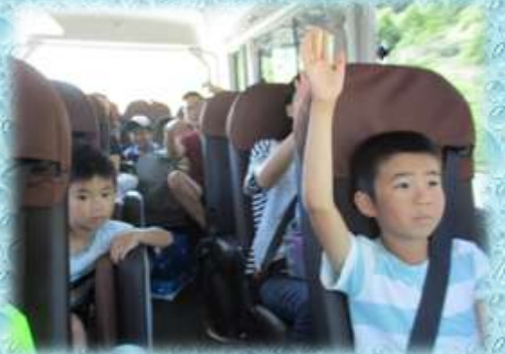
【大人も子供も楽しんで学習】