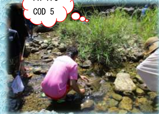
【川の水質も調べました！】