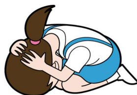
だんごむし の ポーズ(地震:机がない時) 両手で頭を守る