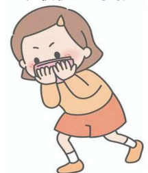
アライグマ の ポーズ(火事の時) 姿勢を低く、ハンカチまたは服で口と鼻をおさえる