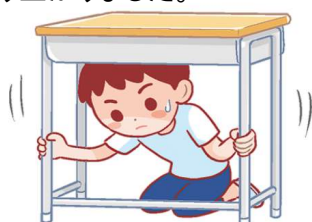
サル の ポーズ(地震:机がある時) 机の下にもぐって頭を守る

サンバに合わせて3つのポーズ。その名は「さるさるサンバ」です。皆さんも一緒に手足を動かし、最後は手拍子で大変盛り上がりました。