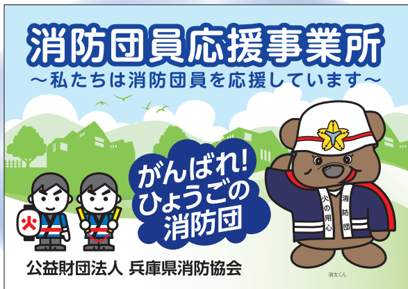
▲消防団員応援事業所ステッカー

自分たちのまちは自分たちで守る」をモットーに、地域で活動している消防団員を地域全体で応援する事業です。