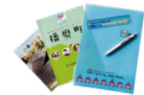
▲播磨町オリジナルグッズ(例)

「3×3 NO.5」のアンケートにご協力をお願いします。ご回答者から抽選で9名(3×3 名だけに!)の方に播磨町オリジナルグッズをプレゼント! また、アンケートフォームでは「3×3」住民ライター参加者も募集中です。