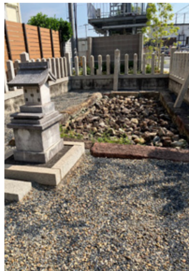
(参考:「古宮の古井戸」説明板/播磨町教育委員会)