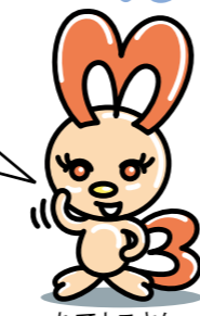
たてよこさん 播磨町の自然を紹介するよ

播磨町には野鳥がいっぱいおると知ってお？ 今回は、カモを紹介するよ。 播磨町で冬によく見かけるヒドリガモ。オスの体は明るい灰色で、頭はチョコレート色。おでこから頭のてっぺんのへんがクリーム色になるのが特徴。ヒドリガモは鳴き声でもわかるねん。いつつモピヨピヨって鳴くけど、時々遠くまで響く笛みたいな声で鳴くんよ。