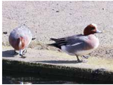
『ヒドリガモ』海で海藻を食べたり、ため池や川でお昼寝したりしています。

①「冬に見られる鳥 ヒドリガモ」 秋にデビューした播磨町PRキャラクターの「たてよこさん」と「てんいちさん」。みなさん、もう覚えていただけましたでしょうか。 町内を探検して美しい風景を楽しむことが好きで好奇心旺盛な「たてよこさん」、読書や研究を通して町の歴史や文化を調べるのが好きな「てんいちさん」です。