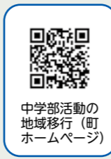
中学部活動の地域移行（町ホームページ）

・アンケートの実施（小学校5・6年生、中学1・2年生と保護者） ・教職員への説明会、懇談会、個別面談の実施 ・中学校入学説明会で小学校6年生と保護者に説明 ※上記ガイドラインやアンケート結果など詳細は町ホームページに掲載しています。