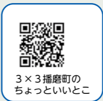
3×3播磨町のちょっといいとこ

このような背景を受け、「質や量の確保をし、持続可能な部活動のありかた」を検討したスポーツ庁が令和4年に「学校部活動および新たな地域クラブ活動の在り方等に関する総合的なガイドライン」を策定しました。