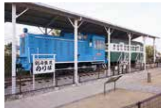
▲別府鉄道（屋外展示）

車両内シート張替工事のため、次の期間中に車両内の見学ができません。（車両近くで外観の見学はできます）日10月1日（火）～10月15日（火）場屋外 別府鉄道機関車・客車