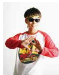
▲バイク川崎バイク