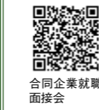
合同企業就職面接会