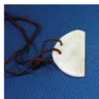
ミニミニ石包丁づくり(有料)