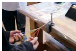
組みひもづくり(無料)