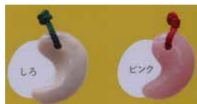
まが玉づくり(有料)

古代人たちの技術や工夫を学ぶためのメニューがそろっています。日 開館日は毎日 場 体験学習室 ※費用は体験内容により設定。 ※当日予約。先着順で定員に達し次第メ切。 ※天候やイベント開催時にはお休みになる場合があります。 ※当日の実施状況は電話でお問い合わせください(079-437-5564) ※詳細については、考古博物館ホームページをご覧ください。