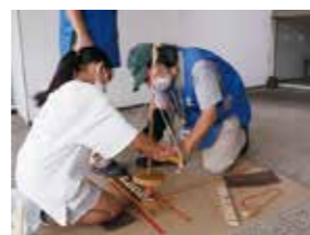
古代の火おこし(無料)