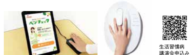
生活習慣病講演会申込み

※ベジチェックとは、手のひらをセンサーに当てるだけで、野菜の摂取量や充足度を測定するものです。※老化物質測定は、お肌のはり、筋肉・血管の動きを阻害する原因となると老化物質を指で測定できるものです。