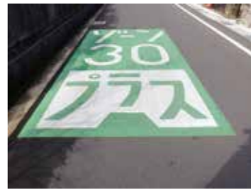
▲ゾーン30プラスの標識

生活道路、通学路の安全を考慮したゾーン30プラスの整備を、播磨西小学校周辺エリアで実施します。