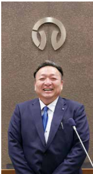
播磨町長 佐伯 謙作