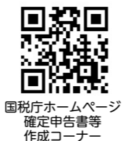
国税庁ホームページ 確定申告書等作成コーナー

▼ 送付先 〒661-8523 尼崎市若王寺3丁目11番46号 大阪国税局業務センター1 阪神分室（加古川税務署担当） なお、申告会場において申告書の作成を希望する場合は、次の点にご留意ください。