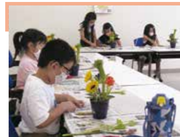
▲フラワーアレンジメント

播磨町中央公民館で子ども教室を開催しています！ 播磨町中央公民館では毎月、いろいろな子ども教室を開催しています。 月ごとに「フラワーアレンジメント」「リボンアクセサリー」「習字」「かきかた」「万華鏡」「インドヨガ」「ビーズクラフト」「ソーラーカー」「絵画」「大工さん」「スノードーム」「オンライン工場見学」「お菓子づくり」などいろいろな体験教室を実施しています。 2月・3月も実施予定です。くわしくは播磨町中央公民館ホームページをご覧ください。 来年度もわくわくする体験を予定します。広報、ホームページをチェックしてください！ ☎ 0794376980 中央公民館