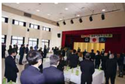
▲コロナ禍に配慮して開催しました

新年交礼会 毎年恒例の交礼会が1月4日に中央公民館で開催されました。これは播磨町商工会が主催して開かれるもので、住民、事業者、議員、町職員が一堂に会して新年のあいさつを交わしました。