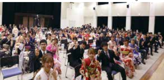
▲播磨南中学校校区の二十歳の皆さん

「Light it up ~未来を照らせ~」をテーマとして、1月8日に播磨町二十歳のつどいが挙行されました。実行委員会が7月から準備し、当日の司会進行も実行委員によって行なわれました。 今年度も、中学校区ごとの2部制で行い、播磨中学校区から14人、播磨南中学校区からは101人の計242人が出席しました。祝辞やメッセージをし、つかり聞く姿が印象的でした。式典後は、懐かしい恩師や同級生との再会を喜びながら、記念撮影をして、心に残る人生の大切な節目の日を過ごしていました。