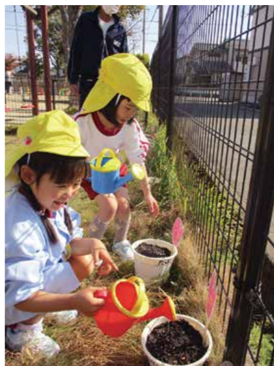
▲早く芽が出ますように…!