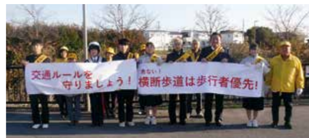
▲播磨南中学校生徒会、加古川交通安全協会播磨支部、加古川警察署で協力して啓発しました

浜幹線の播磨南中学校前の横断歩道が兵庫県警に「おもいやり横断歩道」に指定され、緑色に舗装したことを受け、自動車やバイク・自転車の運転をする人に「横断歩道は歩行者優先」の意識を持ってもらうことを目的に12月7日に啓発活動を実施しました。 今回、啓発活動を実施した場所は播磨南小学校、播磨南中学校、播磨南高等学校の生徒の通学路にもなっています。これからも、生徒たちが安全に通学出来るように「横断歩道は歩行者優先」の意識で交通安全に努めましょう。