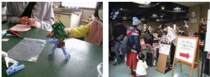
▲作品づくりも人気 ▲ほり出しものもさがせます

3Rフェスタを開催しました 12月11日、3年ぶりに3Rフェスタを開催しました。 3Rフェスタは、例年、室内での開催ということもあり、今年はコロナ感染を考慮し、食べ物のお店及びテーブルマナーセットはできませんでしたが、これまで長年に渡りご愛顧いただきましたガラス工房の見本として作成していた作品の販売、3種類の体験教室、リユース品の販売（応募方式）などを行いました。 大きな混雑はなく作品も売れ、体験教室は子どもも大人もゆっくりと楽しんでいただくことができました。参加している人たちの笑顔を見ると、規模縮小でも開催して良かったと感じることができました。皆さま、ありがとうございました。