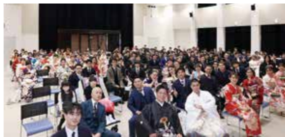
▲播磨中学校校区の二十歳の皆さん