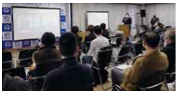
▲参加者の発言を文字起こして各会場のスクリーンに投影する文字支援も実施