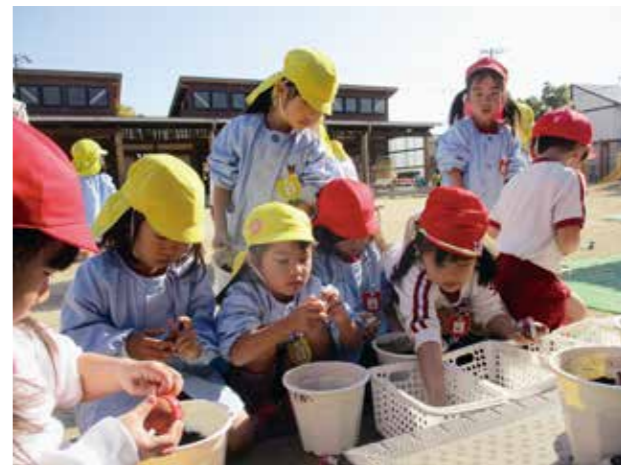
▲「どの色の球根にしようかなあ。」