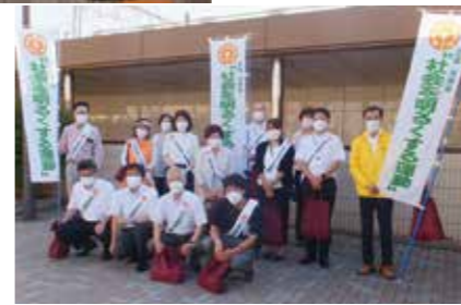
▲「社会を明るくする運動」啓発活動