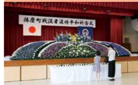
▲平和な世界を祈ります

当日は、猛暑の中、播磨町戦没者遺族会の会員や住民など84人が献花に訪れました。また、中央公民館ロビーでは広島平和記念資料館の所蔵資料を展示する平和展を開催し、訪れた方々に平和の大切さを伝えました。