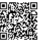
特定健診・後期高齢者健診

集団健診の予約受付はすべて加古川総合保健センター ☎079(429)2923 (受付時間 平日午前8時30分～午後5時) 特定健診の詳しい内容や日程については、町ホームページが広報はりま5月号で配布した「令和4年度播磨町健診のご案内」をご確認ください。