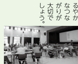
自治会連合会研修会

播磨町には自治会が45団体あります。45自治会からなる組織が播磨町自治会連合会です。今回は自治会連合会で開催した自治会長研修会のレポートです。 自治会連合会では年に数回、自治会長が集まって、自治会運営に関する研修会を開催しています。6月11日に今年度はじめての研修会が中央公民館大ホールで開催されました。研修会では、講師や行政の話聞くだけでなく、他の自治会長と話し合うことで、自治会長同士が顔見知りになる機会としていきます。過去の開催では、自治会長が気になるテーマ（防災、自治会役員、ごみステーション、自治会未加入など）ごとに話し合っていました。今年度は自治会の世帯規模ごとにグループを分け、話し合う時間をもちました。例えば、自治会で開催されているいきいきフォーラムの開催方法や、夏や秋のまつりの開催はどう判断するかなど、コロナ禍を経て、これからの自治会行事を