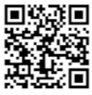
介護保険料減免(新型コロナウイルス感染症)