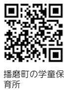
播磨町の学童保育所