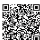
加古川市ホームページ