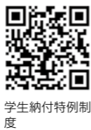
学生納付特例制度