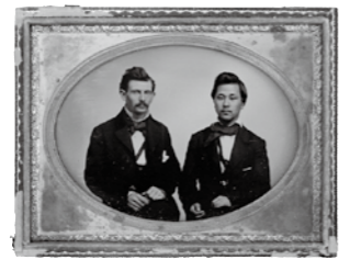
▲ジョセフ・ヒコ(右)

日時 10月16日(土) 13:30～15:00 場所 兵庫県立考古博物館 講堂 講師 大平茂(兵庫県立考古博物館名誉学芸員) 定員 60人 ※事前申込みが必要。先着順受付。