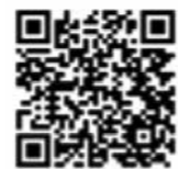
京阪神都市圏交通計画協議会

※結果は、駅前・バスターミナルなどの交通整備、道路計画などを検討する際の貴重な資料となります。協力よろしくお願います。