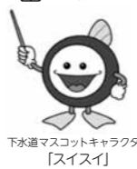
下水道マスコットキャラクター「スイスイ」

家庭から排出された汚水は、下水道をとって汚水処理場できれいな水になって川や海に流れます。