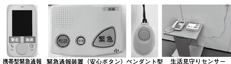
携帯型緊急通報 緊急通報装置(安心ボタン) ペンダント型 生活見守りセンサー

▼申請方法 福祉グループにある申請書にご記入ください。(申請は、ご家族など代理の方も可) ▼問合せ 福祉グループ ☎079(435)2361