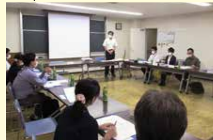
▲第1回コミスク会議の様子

学校運営協議会(以下、コミスク)は、学校づくりを地域とともに進める取り組みです。これまでは、学校評議委員会などの名称で、地域団体などから評議委員が選ばれ、年に数回学校運営について報告・意見交換を行うのが慣例でした。コミスクでは、より具体的に学校と地域の協働をすすめます。これは全国的な取り組みで、播磨町においては令和2年度から蓮池小学校区をモデルとしてスタートしました。9月から学校、PTA、A・コミセン、自治会、各種団体などが集まって、「コミスク」って何をするのか「学校と地域で協働する」とどんなことができるか」などを話し合っています。 蓮池小学校では、灯(ほたる)の会やなでしこの会など、学校と保護者、地域が協働した取り組みがすでにたくさんあります。新しい行事やイベントに取り組んで終わりにするのではなく、これまでの歴史を活かしながら、多くの人を巻き込み、継続性のあるコミスクを目指そうとしています。コミスクの可能性としては、学校づくりをきっかけとして、地域団体の連携が進む可能性があります。これも一つの地域づくりと言えるでしょう。