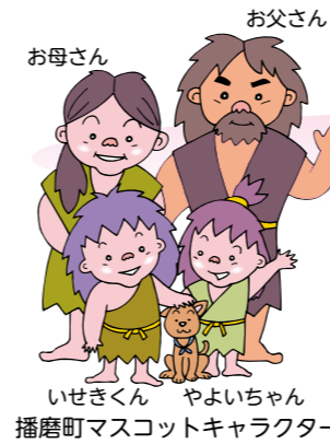
いせきくん やよいちゃん 播磨町マスコットキャラクター