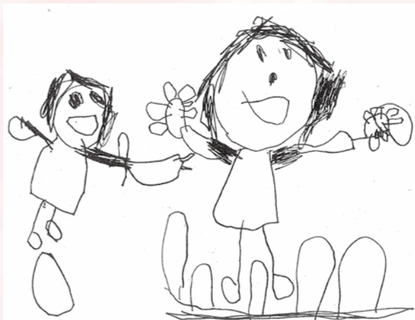
「かわいい おはな みつけた！」 はまの つきひ (播磨幼稚園 4歳児)