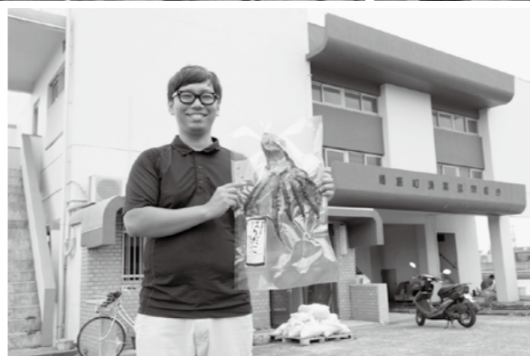
▲タコ飯なら約1升分作れる大きさです！