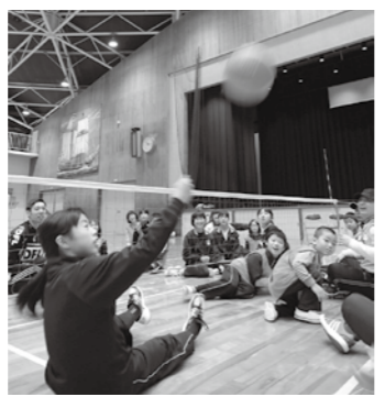
▲シッティングバレー