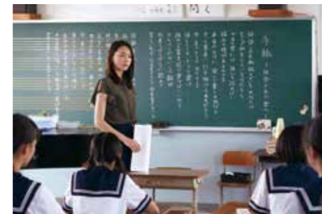
(c) 2015 「くちびるに歌を」製作委員会 (c) 2011 中田永一/小学館