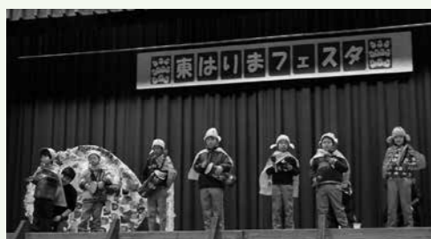
▲東はりま特別支援学校