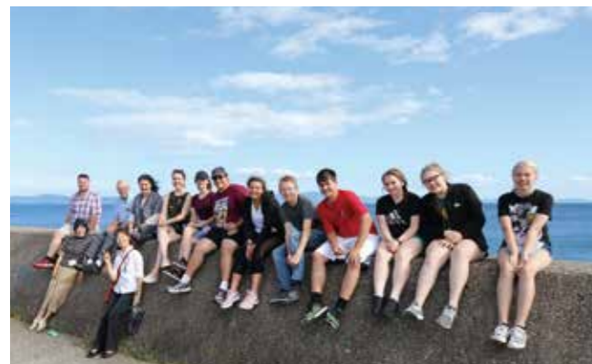
▲播磨町の海をバックに記念撮影する訪問団の皆さん

6月13日から18日まで、ライマ姉妹都市協会訪問団12人が播磨町を訪れ、播磨中学校で授業や部活動で交流をしたり、播磨南高等学校の文化祭を見学したりしました。考古博物館や蓬生庵では、日本の歴史や文化に触れる体験を楽しみました。