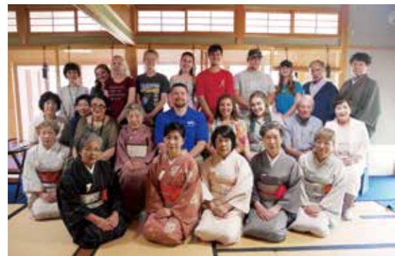
▲蓬生庵でお茶席を体験

ライマ市は、アメリカのオハイオ州の南西部にあり、面積は35km 2 、人口38,000人の小さな市です。緑が豊かで自然に恵まれたところですが、内陸部にあるため海がありません。このため、最終日に関西空港に向かう際に神戸空港から利用する高速船で、海を満喫することも楽しみにしながら、全員元気に播磨町をあとにしました。