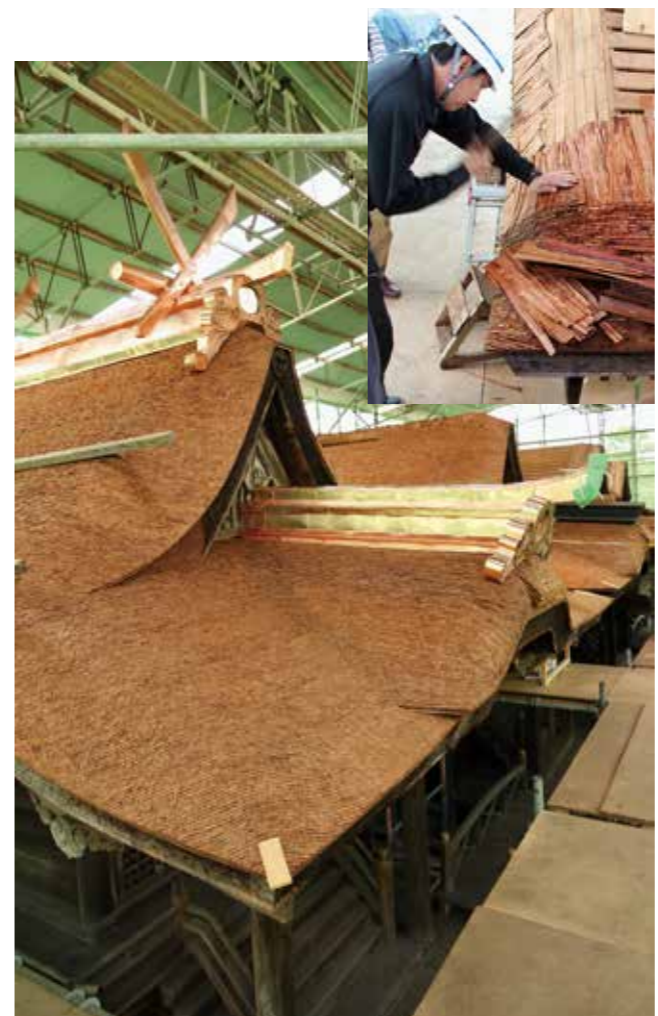
▲阿閑神社本殿は同じ社が4棟並ぶ珍しい社殿で、兵庫県指定文化財に指定されています