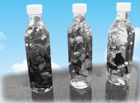
▲ハーバリウムを作ろう