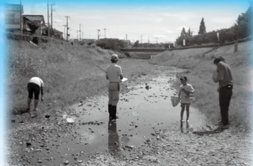
▲魚や虫の観察をしてみよう▼