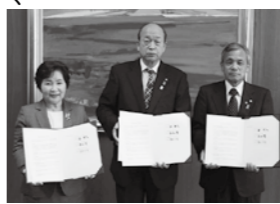
▲1市2町で連携します

町民の消費生活における被害を未然に防止し、くらしの安全を確保するため、消費生活相談業務について連携して取り組むことにより、相談業