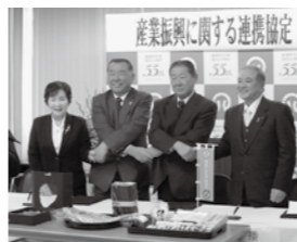
▲町、農協、漁協、商工会の4者が協定書に調印

行政を中心として各団体が相互に連携・協力することで農業、漁業、商工業の振興を図っていきます。地元産の食材を町内の店舗で使用するための販路開拓の支援や、生産者と加工・販売業者をつなげた商品開発に取り組んでいくなど、人的・知的資源を相互に活用し、イベントなどの事業や調査研究で協力することで、産業や観光、文化、まちづくりの各分野で地域の発展を図ります。