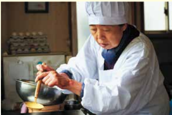
©2015映画「あん」製作委員会／COMME DES CINEMAS / TWENTY TWENTY VISION / ZDF-ARTE 出演：樹木希林、永瀬正敏、市原悦子（113分）

▼主催 播磨町、播磨町教育委員会 ▼共催 播磨町人権・同和教育研究協議会、東部・西部・野添・南部「ミセン」地域推進委員会