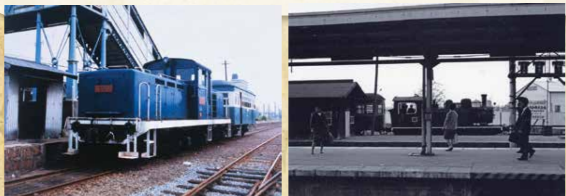
▲土山駅に停車中の別府鉄道車両▲

列島縦断に引き続き列島を横断する路線の検討が行われていました。関西では軍事的拠点である舞鶴と結ぶ計画が主流でした。現在の東海道本線・山陽本線が開通し、次に日本海側と結ぶ路線計画が各地で練られるようになりました。その1つが土鶴線と呼ばれる路線計画です。土山駅と舞鶴駅を結ぶ路線で、もし実現していたら土山駅は播磨の十字路となった可能性があります。そうなっていたら、郷土資料館の前を走っていた路線(であいのみち)も別府鉄道としては存在しなかったでしょう。播州鉄道など兵庫県の路線はその時計画されたものが多く、加古川線・播但線などになって南北交通を担っていました。