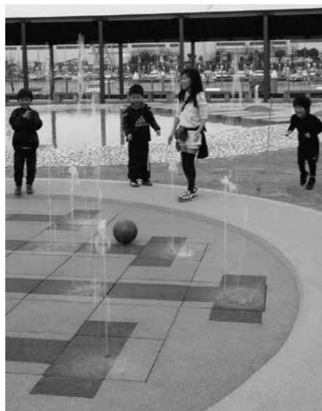
▲うみえーの広場の噴水