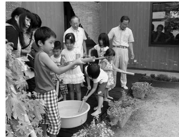
▲南部子育て支援センターの庭で竹水てっぽう遊び