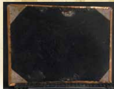
▲ガラス板写真の裏面