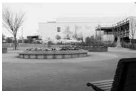
土山駅南 ガーデンプラザ