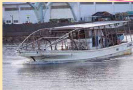
▲網の下に潜り込んで海苔を刈り取る「もぐり船」

天井に持ち上げた網から垂れ下がった海苔を、操舵室の前に設置している回転刃でかき取ります。刈られた海苔は、船の床に作られている水槽に集められます。