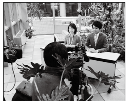
▲2月28日まで播磨わくわく講座を紹介します