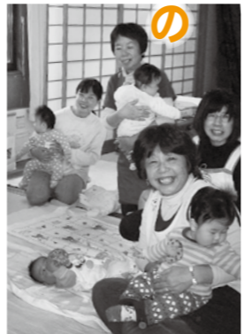
▲離乳食講習会での託児風景