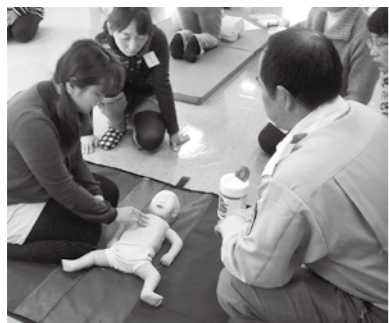
▶前年度の講習会の様子