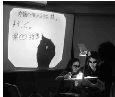
▲講演会場などで活動しています