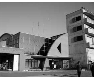
▲加古川市防災センター