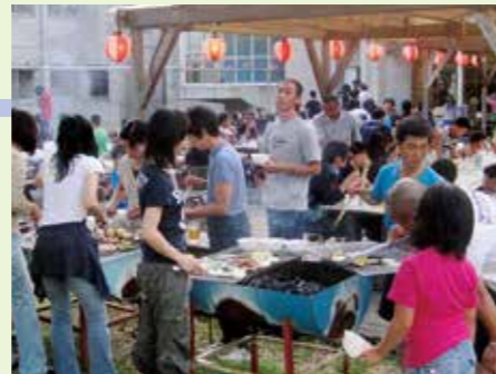
▲テラスでバーベキューもできます

※28人乗りのマイクロバスで無料送迎も可能。(ただし、他の送迎が入っていない場合に限りです)