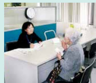
▲気軽に相談できます

平成22年10月より専門の相談員による相談をスタートしました消費生活相談コーナーに、専用の相談室ができ、よりプライバシーに配慮した形でご相談をお受けできる体制を整えました。「相談しているところを知り合いに見られたくないなあ」と思われる方