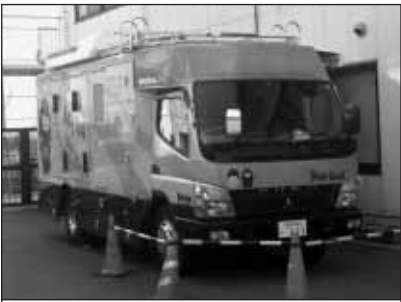
▲3月28日南部子育て支援センターで番組収録を行います。