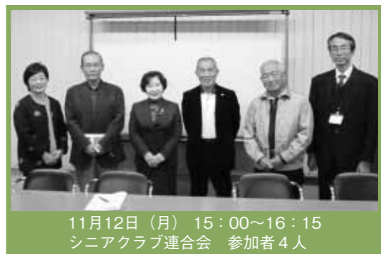
11月12日(月) 15:00~16:15 シニアクラブ連合会 参加者4人