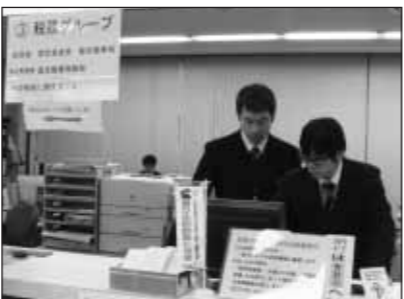
▲確定申告について、詳しくお伝えします (放送日2月1日~15日)

化施設を造ってはどうか A 町の財政は良い方だが経常的な収支は厳しい。長寿祝金も縮小した。これからも社会保障費は増えていく。文化ホールをつくり年間多額の管理費をかけて維持していくのはどうか。土山駅前には景観を考慮して低層でも住民や駅利用者の利便性が増すようなものをと思う。施設の延命化は図りたいが新たにムダな箱物を造るのは避けたい。また、そのような施設は賃借料が高く、利用日も土・日に偏る。公民館改修の際、利用者に尋ねたら平常使うサークルなどで安価に使える方がいいということ、建て直しではなく少しずつ改善するような形にした。健康いきいきセンターの3階にホールがあるが、今後指定管理者がどのように利用していくか課題 Q しあわせセンターの駐車場は無料なので、いきいきセンターの利用者が駐車している。有料にして関係者は無料になるような仕組みを作ればいい A 社会福祉協議会も検討しているかもしれないので一度確認し、設置費と維持管理費であり大きな投資にならないようなら検討したいと思う